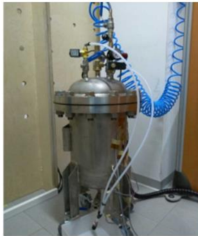
Demostrador o escala laboratorio.

El Centro Tecnológico CTC ha desarrollado un gemelo digital que monitoriza y muestra el comportamiento de los depósitos a presión empleados dentro del ámbito industrial. Esta solución permite observar la tensión y la fatiga acumulada provocados por los cambios de temperatura y presión en el recipiente, factores críticos para sectores que operan con sustancias peligrosas y que resultan difícilmente inspeccionables con las soluciones actuales.