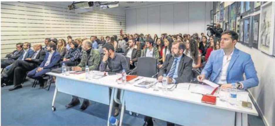
El jurado valora los proyectos de los diez equipos finalistas en una edición anterior del programa. DM

La defensa de los diez proyectos tendrá lugar el próximo 25 de marzo en el salón de actos de Uneatlántico